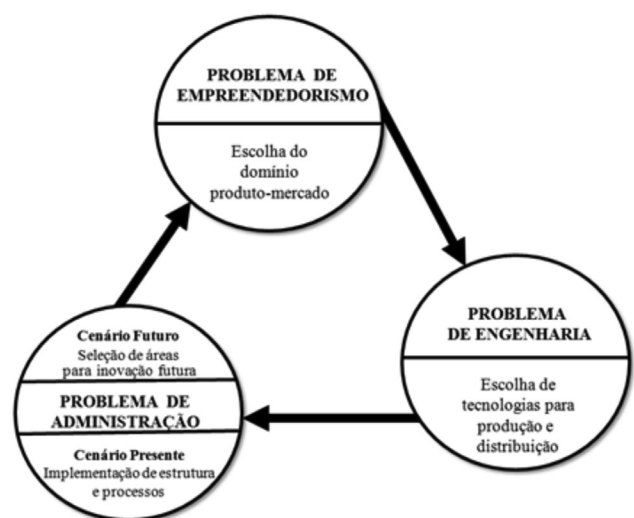
Figura 1 – Ciclo de adaptação da organização ao ambiente externo